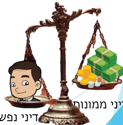
דיני ממונות דיני נפשות

"היו יודעין שלא כדיני ממונות דיני נפשות - דיני ממונות, אדם נותן ממונו ומתכפר לו. ודיני נפשות, דמו ודם זרעיותיו תלויים בו עד סוף העולם"